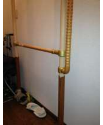
良く使用しています:①ベッド ②4点杖③滑り止めマット ④立上りバー(差し込み式)(廊下・玄関等取付型)